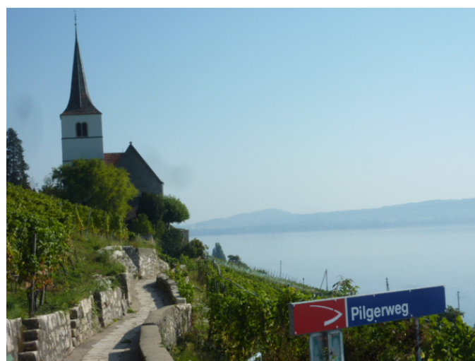
Kirche Ligerz an der Station Pilgerweg