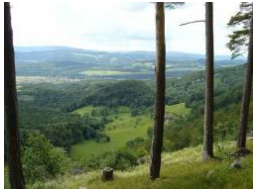
auf dem Blauen