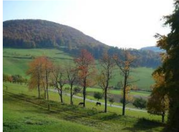
unterwegs in herbstlicher Landschaft