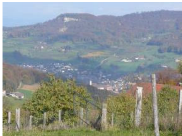
... zur Sissacherflue