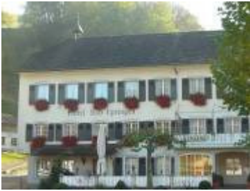
Restaurant Bad Eptingen

Leuenberg - tägl. geöffnet / Tel.: 061 956 12 12 / www.leuenberg.ch (ref. Heimstätte)