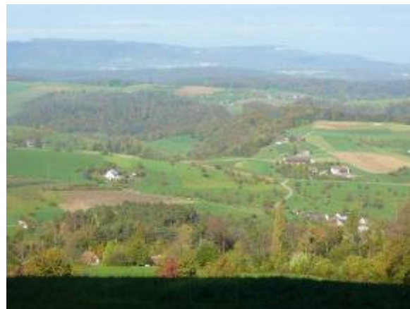
... zur Schauenburgerflue