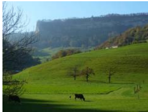
Blick in Richtung Belchenflue