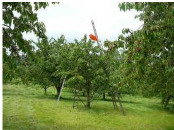
<- Wasserfall des Eibach bei Zeglingen