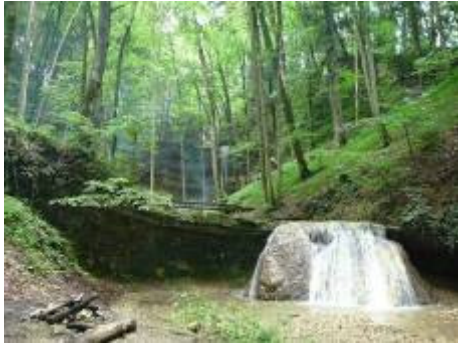
Beim Wasserfall Giessen

Restaurants: Bad Ramsach, täglich geöffnet, Tel: 062 285 15 15 www.bad-ramsach.ch (Hotel)