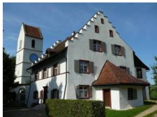
Kirche und Pfarrhaus Oltingen

<- zwischen Zeglingen und Oltingen