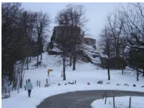
"Schloss" Dorneck unmittelbar nach dem Schlosshof