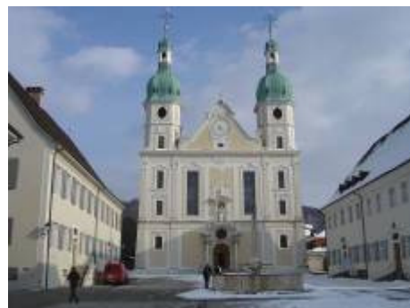
Dom in Arlesheim