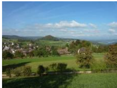
Titterten und Chastelenflue