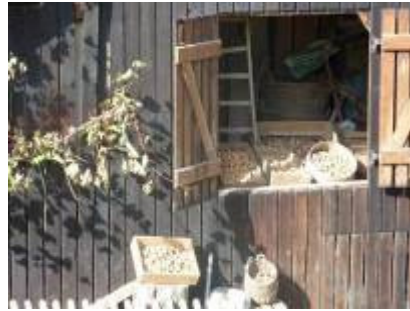
"Nusshof" in Titterten