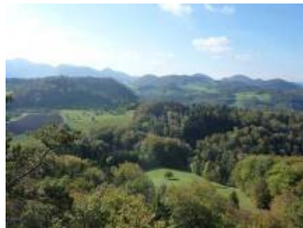
Blick von der Chastelenflue nach Westen