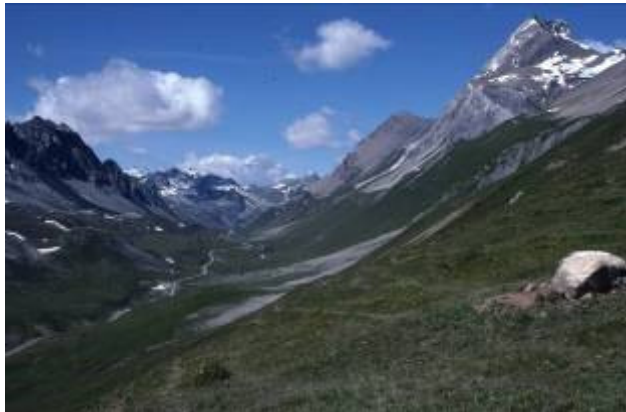
Vor dem Albulapass

Variante für Wanderer, die ( Hinweis ) Kraxlerei und einen Gletscher nicht scheuen: Von der Es-Cha-Hütte über die Porta d'Es-cha zur Keschhütte und weiter entweder nach Tuors - Bergün oder nach Davos.