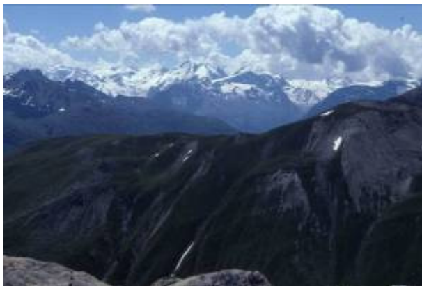
Blick zur Berninagruppe