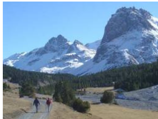
im Val Mora