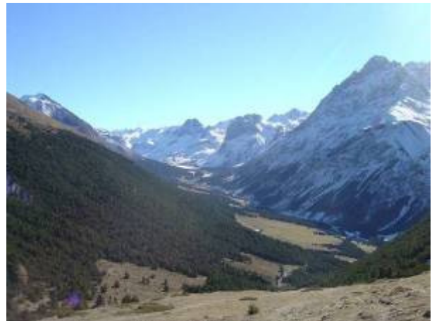
Blick hinunter ins Val Mora