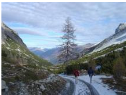
und abwärts durchs Val Vau...