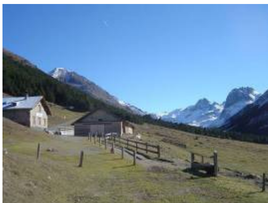
Alp Val Mora