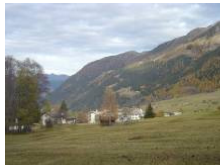
... nach Sta Maria