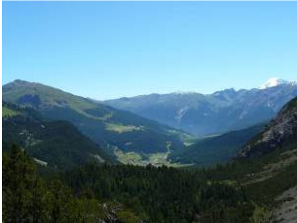
Blick vom Ofenpass ins Val Müstair / Ortler

Flora: Beim Munt la Schera hats viele Edelweiss.