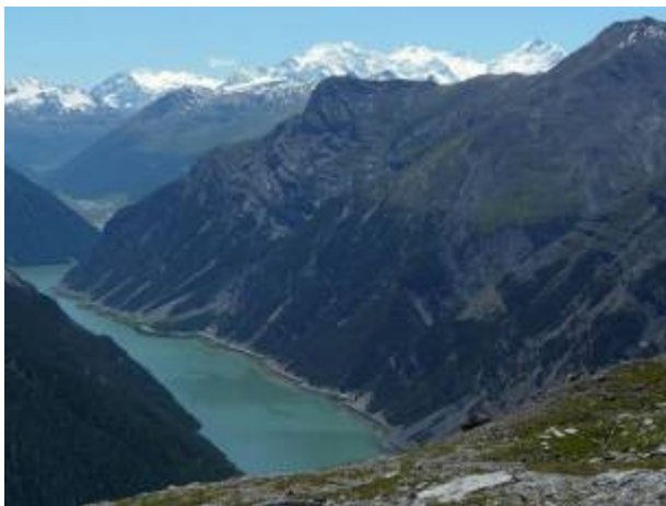
Livignostausee und Berninagruppe