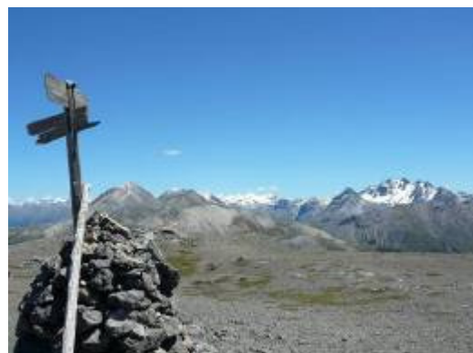
Munt la Schera - oben.