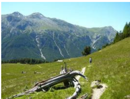
Alp La Schera