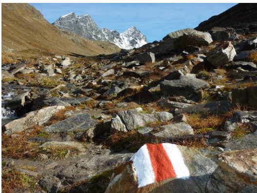
weiter in Richtung Flesspass