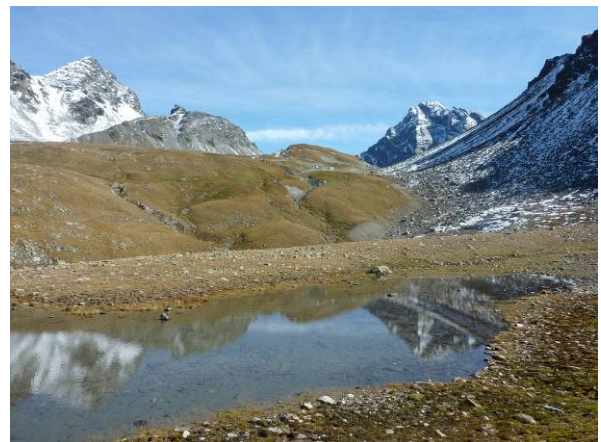
Am Flesspass mit Blick zum Vereinapass