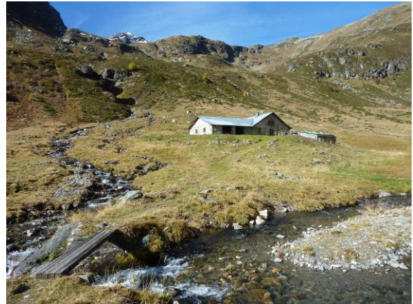
Alp Fless Dadaint