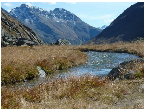
Abstieg durchs Val Sagliains