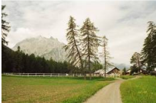
"Kanada Ranch" San Jon