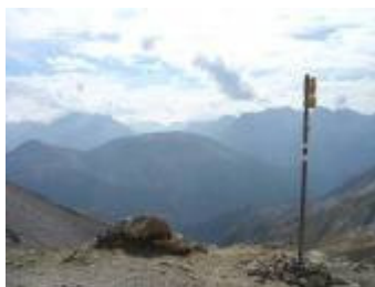
...zur Fuorcla da Val dal Botsch