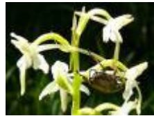
... im Val Plavna ...