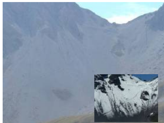
diese Gröllhalde hinauf gehts von links unten hoch in den Sattel (vgl. Spur)...