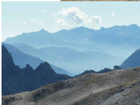
Blick zum Veltlin