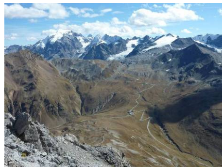
Stilfserjoch mit Ortlergruppe