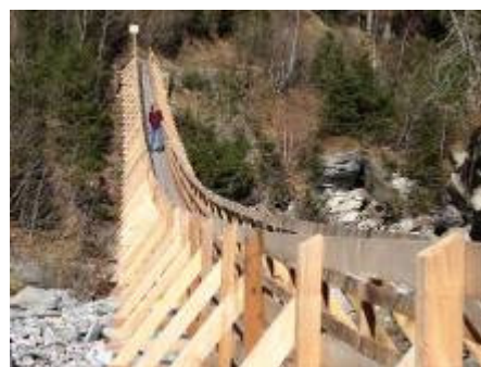
Hängebrücke auf dem Weg zurück zum Kurhaus Hotel Val Sinestra