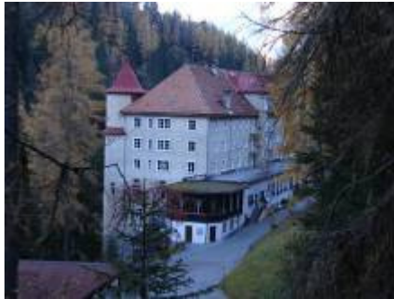
Kurhaus Hotel Val Sinestra

Tiere: evt. Hirsche und Gämsen (Feldstecher).