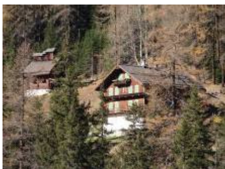
Villa Mengelberg und Mengelbergkapelle