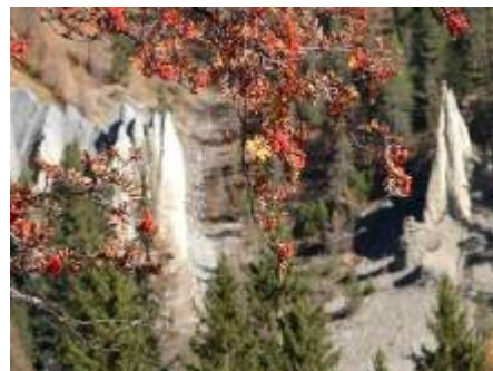
Erdpyramiden San Peder