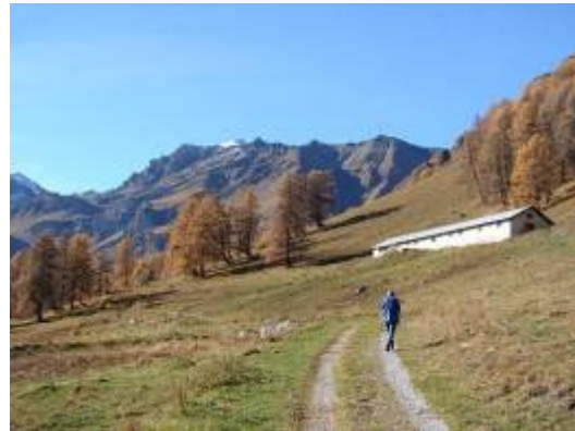
im Val Laver