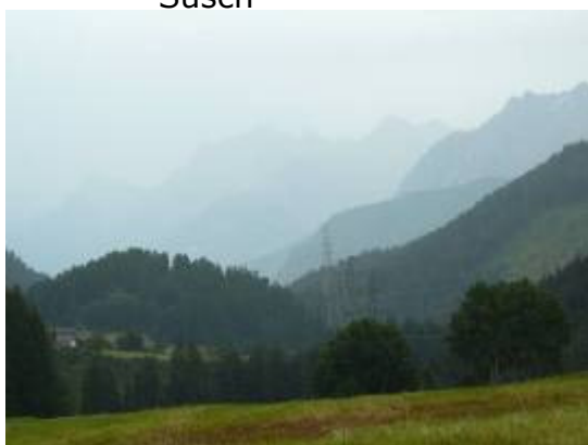
Blick das Tal hinab - mit Gewitter im Anzug