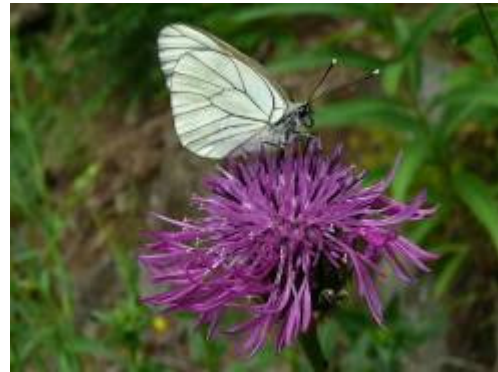
Blumen und Insektenvielfalt